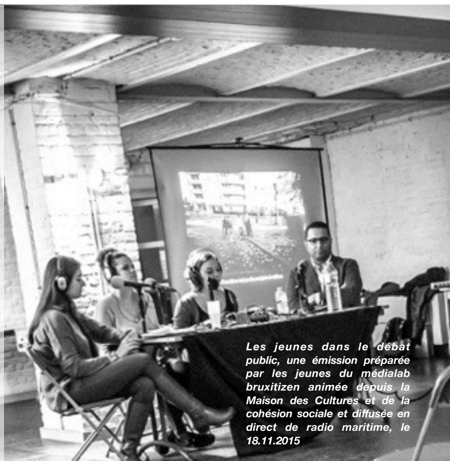
Les jeunes dans le débat public, une émission préparée par les jeunes du médialab bruxitizen animée depuis la Maison des Cultures et de la cohésion sociale et diffusée en direct de radio maritime, le 18.11.2015