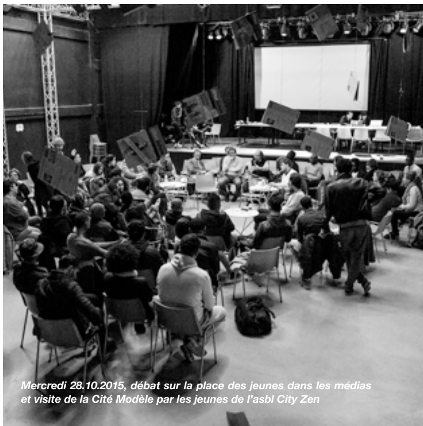
Mercredi 28.10.2015, débat sur la place des jeunes dans les médias et visite de la Cité Modèle par les jeunes de l'asbl City Zen