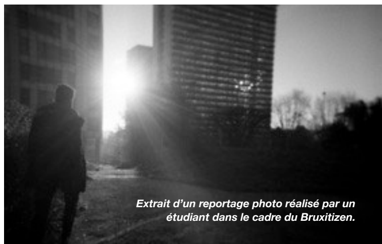
Extrait d'un reportage photo réalisé par un étudiant dans le cadre du Bruxitizen.

Collectif de photographes fondé en 2011, l'ambition du collectif est de construire à travers la photographie un instrument pour redonner la parole aux acteurs sociaux et aux laissés pour