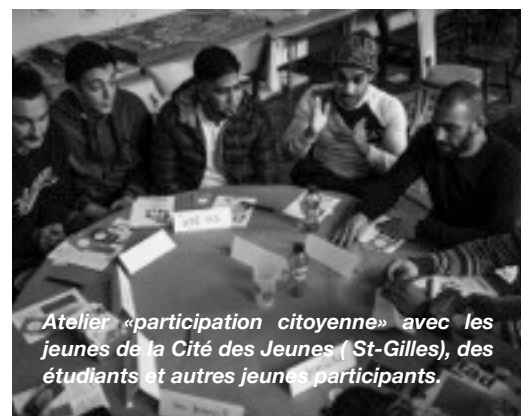
Atelier «participation citoyenne» avec les jeunes de la Cité des Jeunes ( St-Gilles), des étudiants et autres jeunes participants.