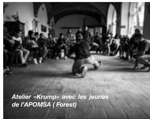
Atelier «Krump» avec les jeunes de l'APOMSA ( Forest)