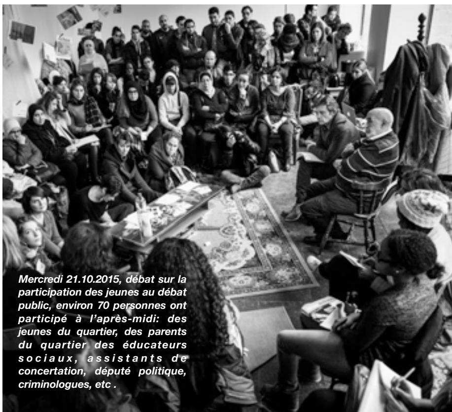
Mercredi 21.10.2015, débat sur la participation des jeunes au débat public, environ 70 personnes ont participé à l'après-midi: des jeunes du quartier, des parents du quartier, des éducateurs sociaux, assistants de concertation, député politique, criminologues, etc .