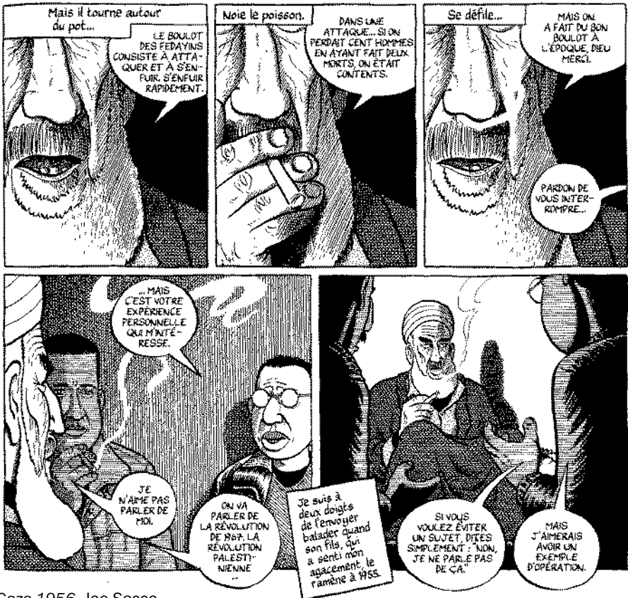
Gaza 1956, Joe Sacco

Ne partez pas la fleur au fusil! Préparez votre entretien. Écrivez, dans un petit carnet, une série de question. Notez toutes les questions qui vous viennent à l'esprit en préparant l'entretien. Pendant l'entretien, vous ne poserez sûrement pas toutes ces questions mais elles seront une sorte de support, de fil à tirer.